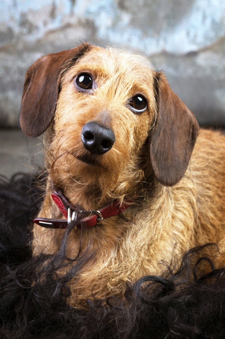
Ximo, alias Eddy